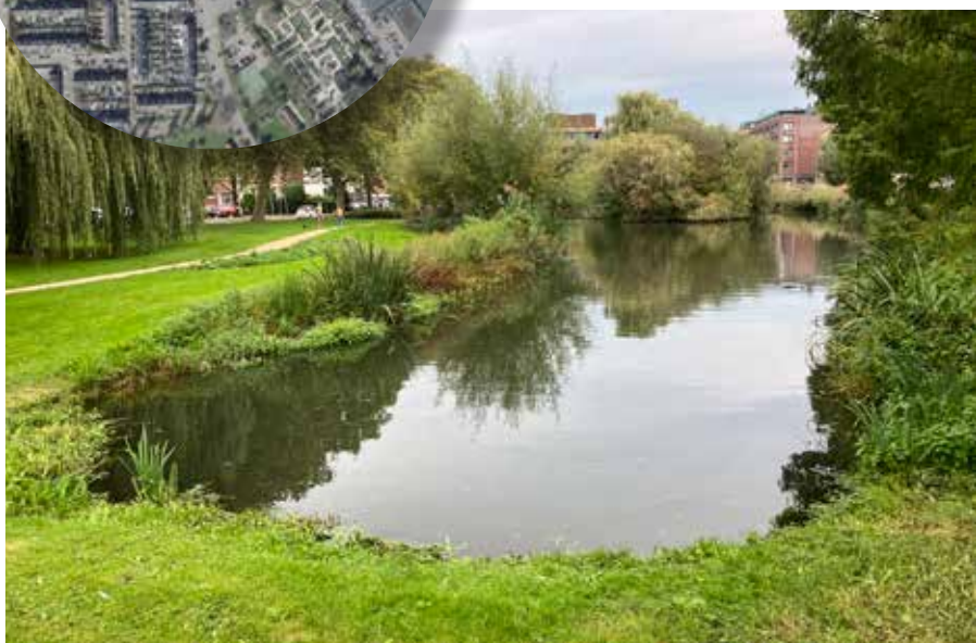
De hoek van de singel bij de Coosje Ayalstraat.