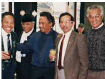
Receptie na het verkrijgen van de Rietkerkpenning.

niseerde ook bijeenkomsten voor christen- en moslimmolukkers om de rust te bewaren in Nederland.