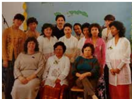
Opening stichting Madju

In 2000 werd de landelijke vereniging Vrouwen voor Vrede op de Molukken opgericht. Deze vereniging bestaat uit protestanten, katholieken en islamitische vrouwen. Op de Molukken waren er op dat moment gewelddadigheden tussen de verschillende geloven. Hier wilde men iets aan doen. Door de organisatie werden vredesweekenden georganiseerd en stille tochten om aandacht te vragen voor de situatie op de Molukken. Men orga-